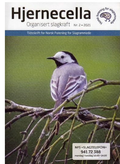
Forside Hjernecella nr.2 2021